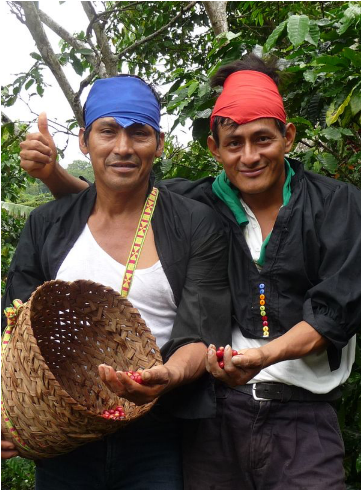
Coopérative Oro Verde Pérou, récolte du café